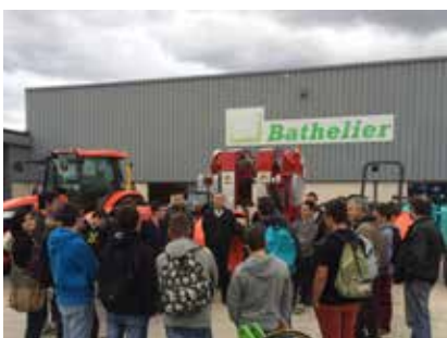
BATHELIER - PORTES-OUVERTES