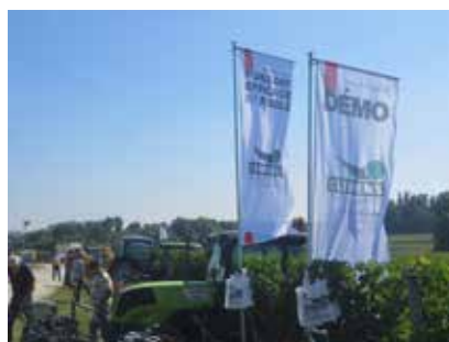
MAUNAI-MANGARD - LYCÉE AGRO