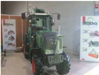
DIONYSUD AVEC MATHA