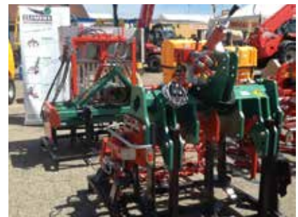
JANSOULIN - BRIGNOLES