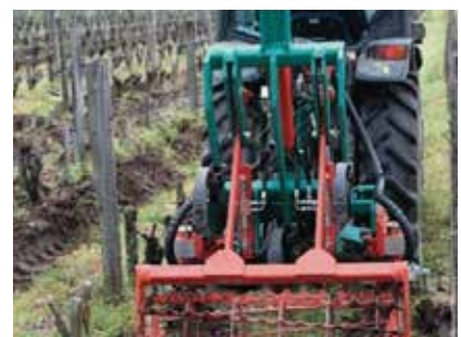
DEPAN AGRIC - CHAMBRE AGRI GIRONDE