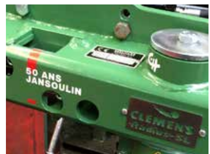
RADIUS - SÉRIE SPÉCIALE