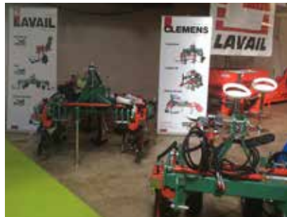
DIONYSUD AVEC LAVAIL

Un résumé non-exhaustif en images de nos récentes activités. Nous profitons de l'occasion pour remercier tous nos partenaires pour cette année 2014 et aussi tous nos clients pour leur confiance et leur fidélité.