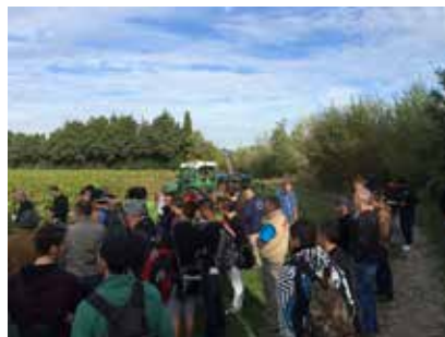
TECH AND BIO - LA PUGÈRE