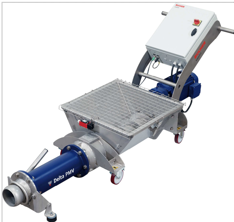
Delta PMV 2

Als Aufnahmebehälter der frischen Trauben stehen die PMV Delta mitten im Weinbereitungsprozess und sind auf den Transport von Trester abgestimmt (Delta PMV1 ausgenommen).