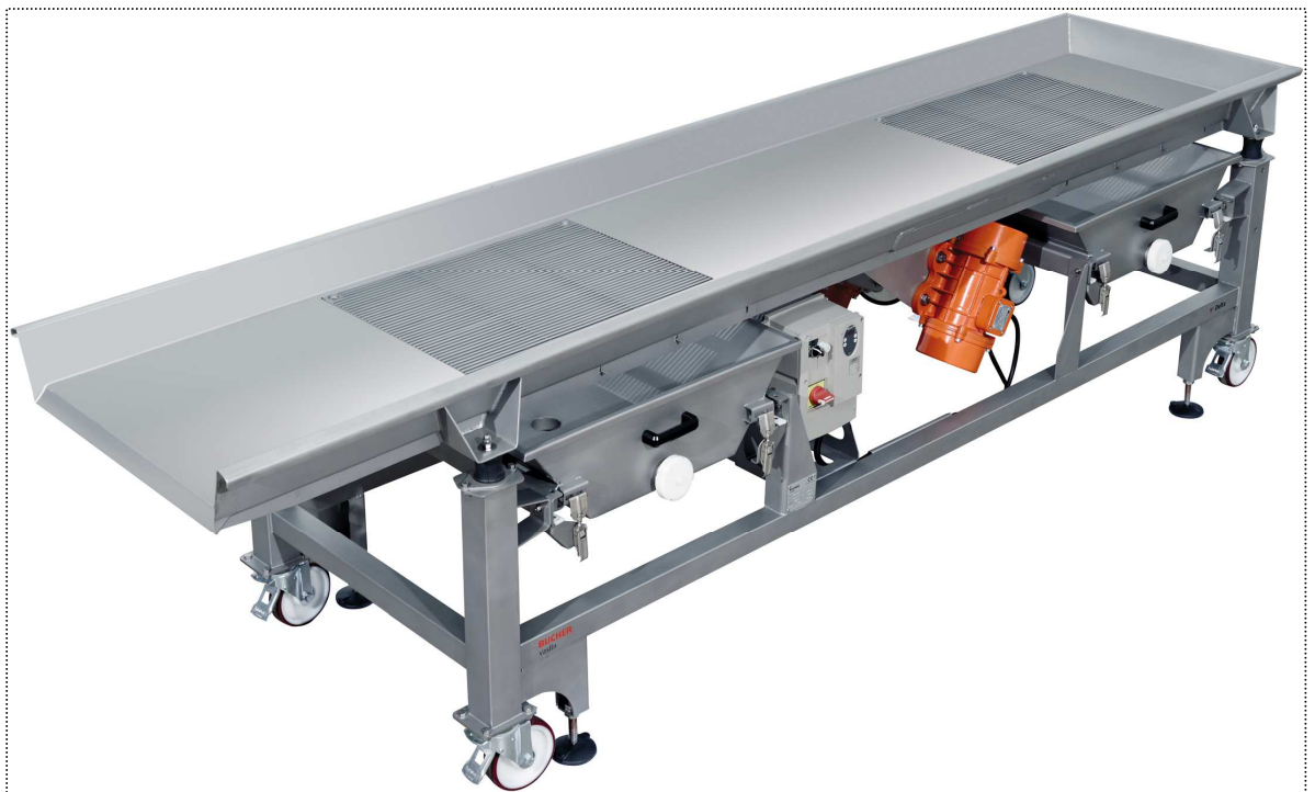
Delta TRV 35