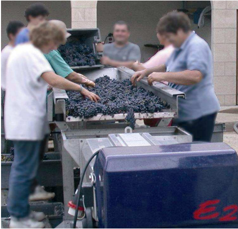
Tisch vor der Abbeermaschine